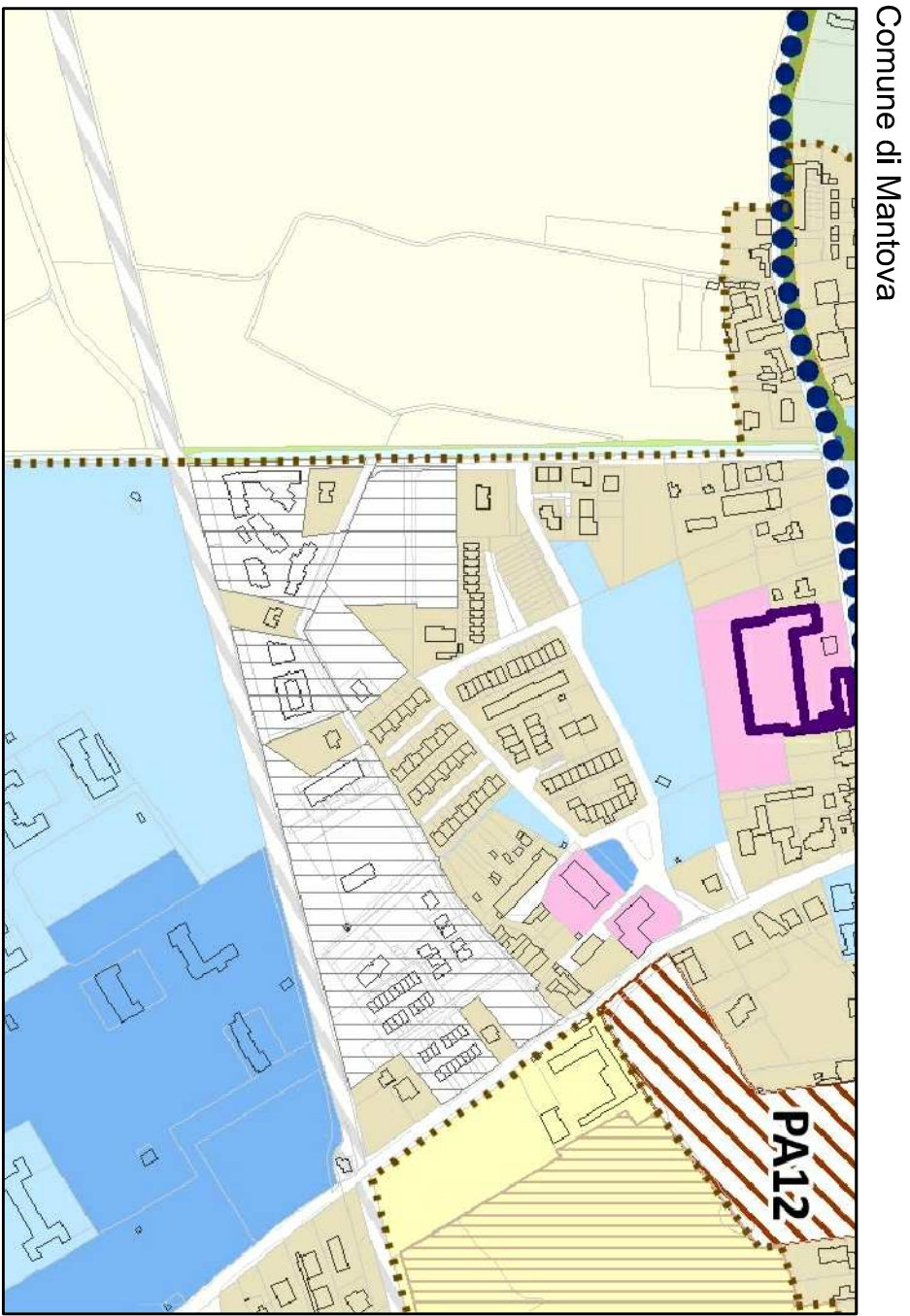
ESTRATTO PIANO DI GOVERNO DEL TERRITORIO